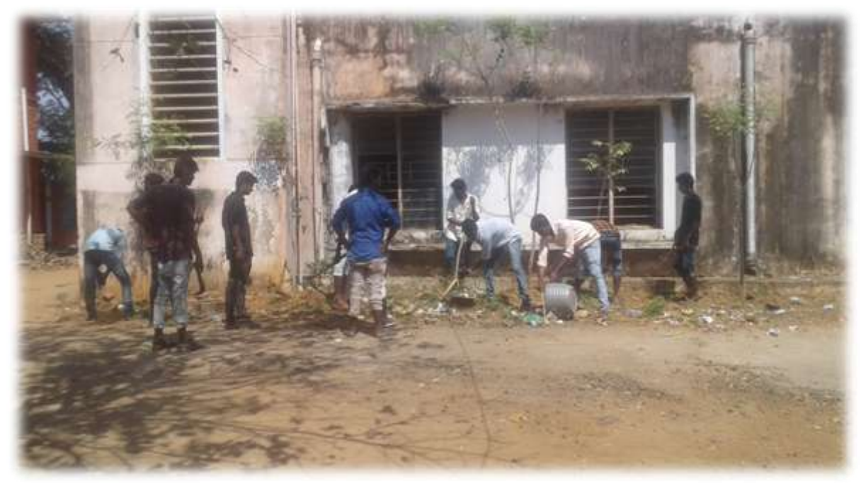
Cleaning College Campus