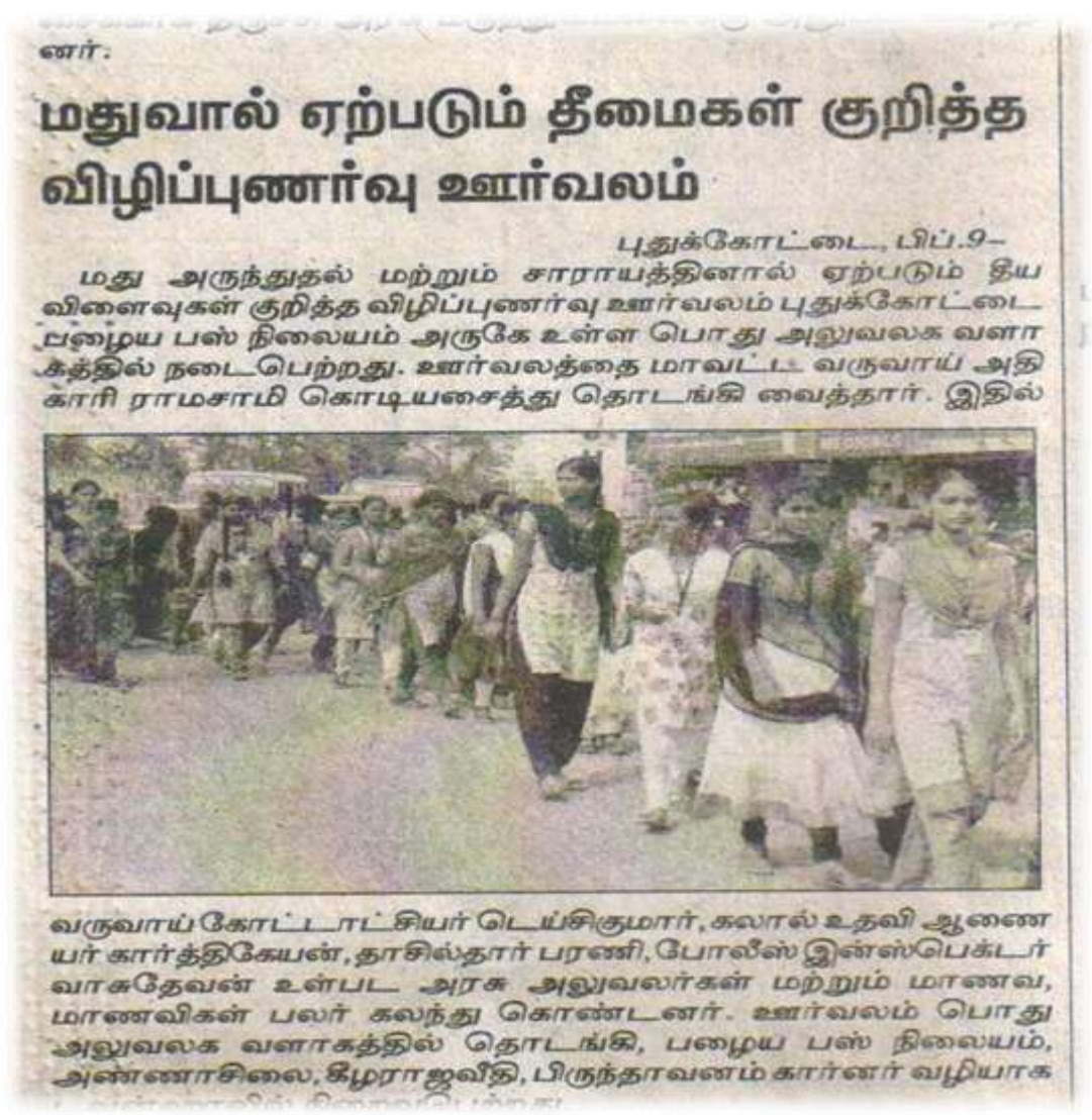
NSS Volunteers participated 'Alcohol Abuse Awareness' programme